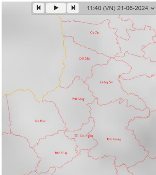
Hình 1: Ảnh vệ tinh tại khu vực tỉnh Đắk Nông

Qua theo dõi ảnh mây vệ tinh và ảnh radar thời tiết Pleiku cho thấy mây đối lưu phát triển gây mưa trên một số nơi thuộc huyện Đắk Glong và TP. Gia Nghĩa.